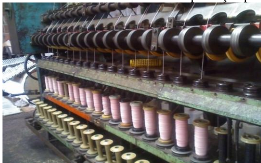
(Figura 4: Fiadeira em atividade.).

A fibra do caroá passava por todo um processo de beneficiamento até chegar ao produto final. A maior parte desse beneficiamento era feito através de máquinas que eram operadas pelos trabalhadores e que a princípio, eram movimentadas por energia gerada a diesel e gás natural. A energia elétrica viria bem mais tarde.