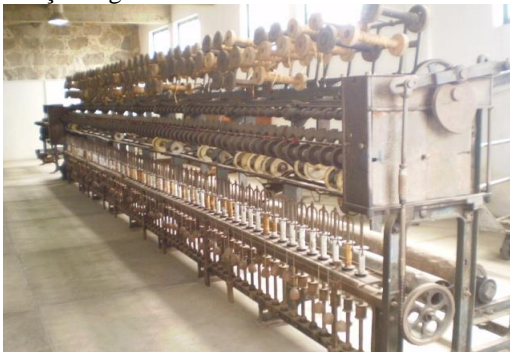
(Figura 3: Fiadeira de fabricação inglesa instalada no Museu da Fábrica.).

A fibra do caroá passava por todo um processo de beneficiamento até chegar ao produto final. A maior parte desse beneficiamento era feito através de máquinas que eram operadas pelos trabalhadores e que a princípio, eram movimentadas por energia gerada a diesel e gás natural. A energia elétrica viria bem mais tarde.