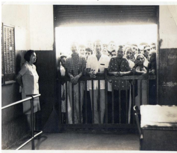
(Figura 8: Trabalhadores a procura de emprego na fábrica na década de 1970. Fonte: PEREIRA e TEIXEIRA, 2011)

A figura 8 mostra pessoas à procura de emprego nos portões da fábrica. A foto é da década de 1970 e mostra que, mesmo no seu pior período de funcionamento a fábrica ainda atraía trabalhadores à procura de uma ocupação remunerada. As vagas de emprego em Caruaru não eram muitas e a fala de José Bezerra, ex-funcionário da fábrica explica bem a situação: “ou trabalhava nessa meia dúzia de firma que tinha [sic] aqui ou era agricultor”.