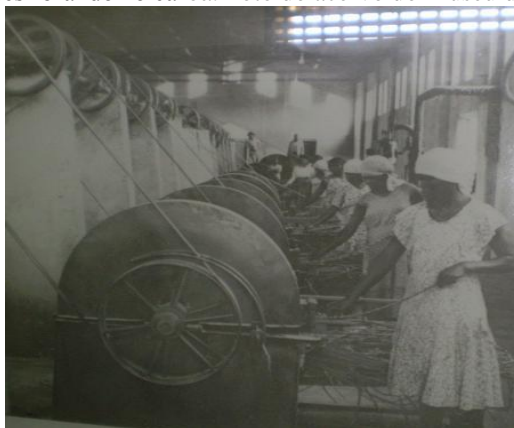
(Figura 5: Operárias “desfibrando” o caroá. Data incerta)